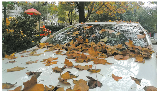
树叶飘落在车顶上成为冬日一景。

本报讯 (记者 戚颖璞)上海最近的阴雨天气,差点刷新了气象纪录。今年1月1日以来,上海各个区的气象站日照时数普遍不足2小时,徐家汇、青浦、闵行、浦东、松江、奉贤等6个站基本没有有效日照。