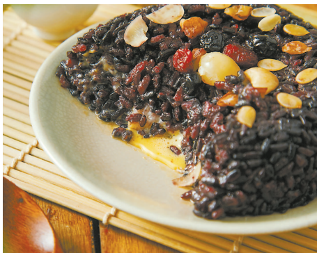
流心奶黄八宝饭。资料照片