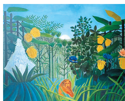
许凤英的作品。详细报道刊6版▶