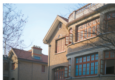
冬日暖阳中的思南路。 详细报道刊6版▶