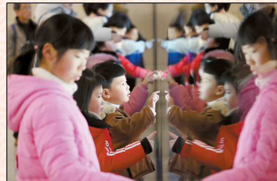
游客在上海市历史博物馆“魔镜墙”上探寻上海发展历史进程。

过“文化年”日渐成为沪上新潮流，各博物馆、美术馆已早早备好大餐，各类充满浓浓年味的展览静候来客。春节期间，上海84家博物馆、29家美术馆照常开放，众多新春系列特展和主题展览为申城渲染出浓郁的节日气氛。 刊2版►