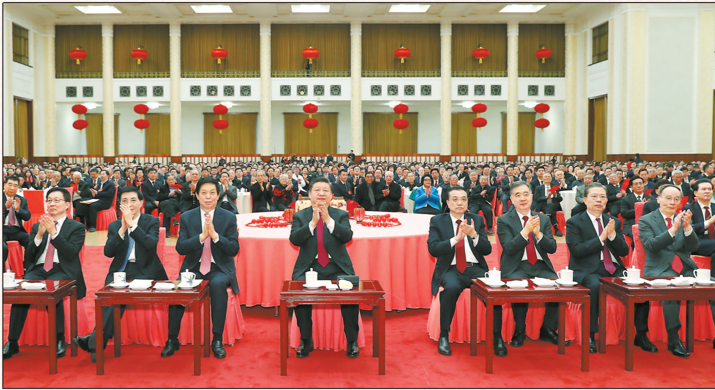
党和国家领导人习近平、李克强、栗战书、汪洋、王沪宁、赵乐际、韩正、王岐山等同首都各界人士欢聚一堂，共迎新春。