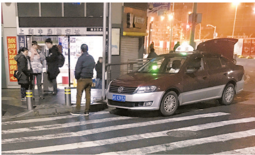
上海火车站附近,一名出租车司机正在揽客。