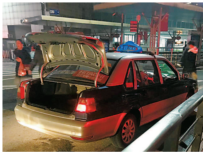
等在路边的出租车打开后备箱盖以躲避摄像监控。