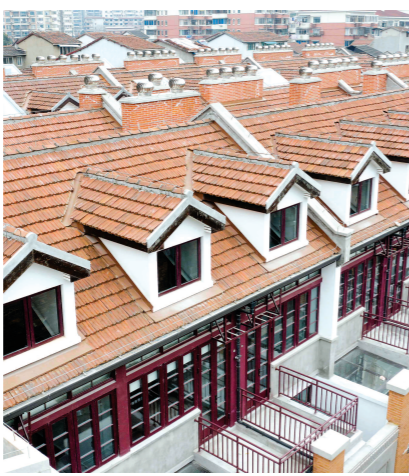
春阳里二期以崭新面貌迎接居民。