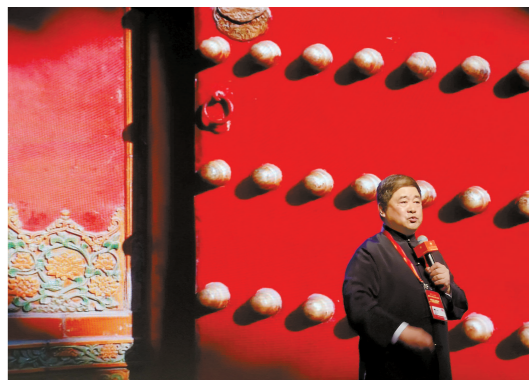
2月17日,在2019年亚布力中国企业家论坛上,故宫博物院院长单霁翔做主题演讲。