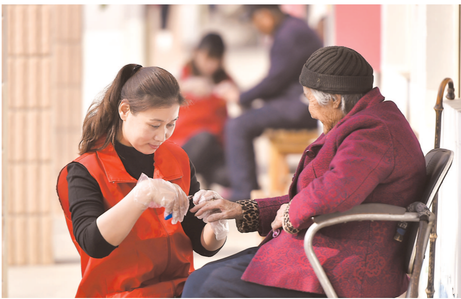
2019年3月4日,在山东明集镇一家敬老院,志愿者为老人修指甲。在学雷锋纪念日即将到来之际,多地开展义务劳动、送温暖等志愿服务活动,以实际行动传承雷锋精神。

报》、《光明日报》、《中国青年报》等都在头版显著位置刊登了毛泽东的题词“向雷锋同志学习”。之后每年的3月5日也就成了学雷锋的纪念日。