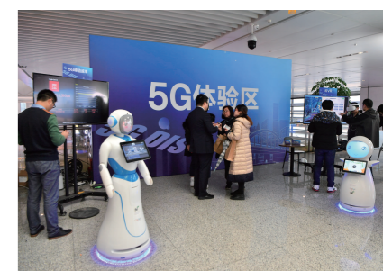
上海移动启动首个5G火车站建设,推动5G先试先用。

动将全面打造‘建网快、品质优、应用丰富’的‘双千兆城市’,推动主城区、郊区业务热点区域、垂直行业应用区域的5G连片覆盖,加快5G垂直行业跨界融合,全力以赴为实施长三角区域一体化国家战略贡献力量。”上海作为长三角的龙头城市,良好的总体经济环境、系统的产业规划布局、巨大的市场发展潜力、集聚的人才优势等,不仅为5G先试先用提供了扎实土壤,更便于5G作为基础支撑赋能上海数字经济活力,在辐射带动区域经济发展、对外配置全球资源、服务国家战略方面不负党中央的嘱托。上海移动将积极锻造生态竞争能力,坚决落实提速降费,全力做好上海市政务云平台和“一网通办”应用系统的运维保障,以更多维的身份和更丰富的投入,推动网络强国战略落地。