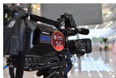
上海移动完成上海市“两会”首次5G直播连线。

随着全球5G商用日益临近,中国移动在上海开展了一系列5G非独立组网(NSA)外场测试,为设备供应商提供了验证5G关键技术的实验平台。作为O-RAN联盟的创始成员,中