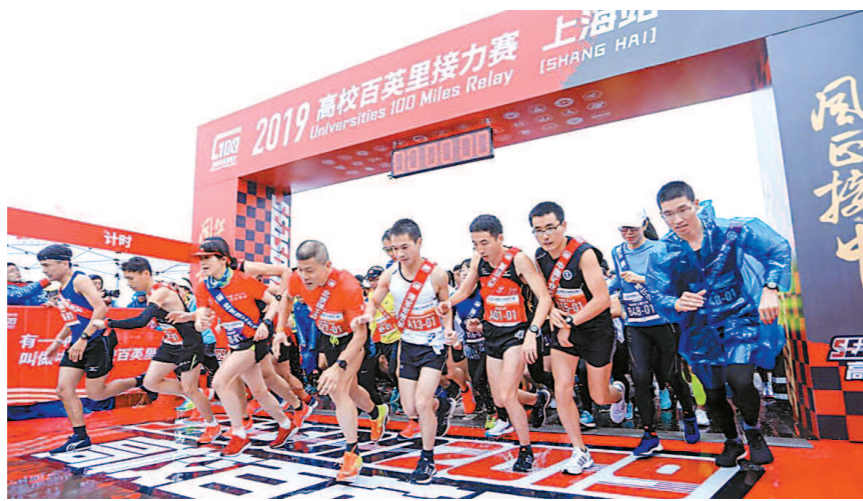
来自全国39所高校的55支队伍上周末在前滩友城公园展开激烈角逐。

复旦大学的小覃还在赛道上挥汗,由他“主演”的“微电影”已被队友们分享到了朋友圈,引来点赞连连。“高百”利用人脸识别照片分拣技术和短视频拼接技术,让跑者能够即时找到自己或者队友的比赛照片,并自动生成一段H5小视频。爱跑的人几乎都爱“晒”,大多跑者希望借“晒照”