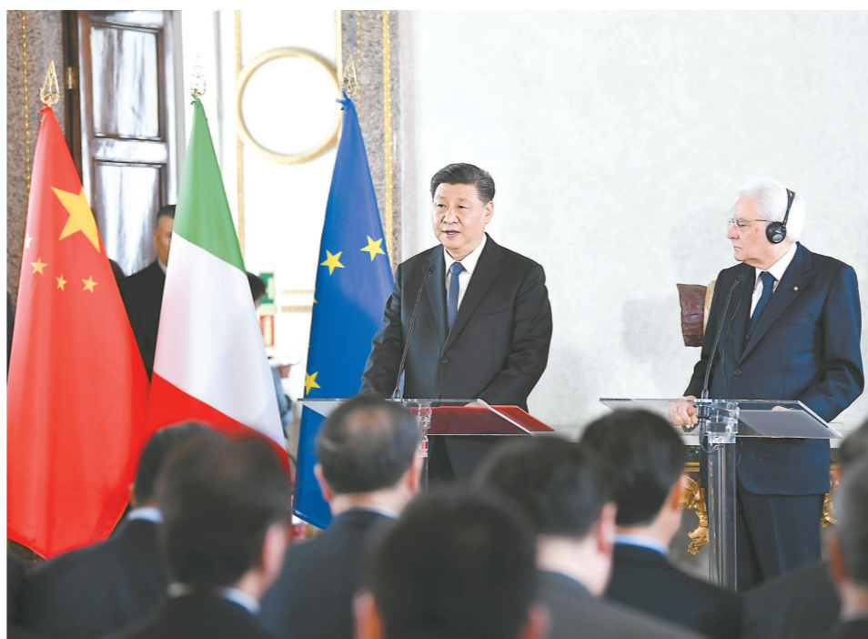
3月22日,国家主席习近平在罗马和意大利总统马塔雷拉一道会见出席中意企业家委员会、中意第三方市场合作论坛、中意文化合作机制会议双方代表。