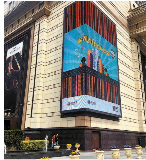
环球港责任区视频宣传

党中央领导对上海提出了“勇创国际一流城市管理水平”的要求。全市各级管理部门深刻领会指示精神,深入贯彻《上海市市容环境卫生责任区管理办法》,按照全要素管理理念,落实市委、市政府“管为本、重体系、补短板”的城市管理要求,立足实际、更新理念、大胆探索,不断提升管理效能,优化区域环境,为建设卓越的全球城市增光添彩!