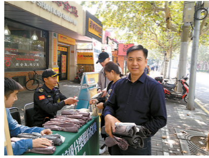
华阳路街道积分兑换活动

集的规则、考核办法和奖惩措施,对每家商铺的主动投放情况,分类准确情况进行考核,对积极参与分类投放的商铺,发放积分卡,定期开展兑换活动,鼓励商铺积极参与。 二、统一标准,队员亲自示范 按照上海市垃圾分类工作标准和区分减联办具体要求,街道对上门收集队员进行了专门培训,统一标准。在收集过程中,对不主动参与的商铺,队员主动上门进行宣传、教育和督促。对不自觉、不分类的商铺,队员及时在现场对商铺人员进行作业示范,直至商铺人员愿分类、会分类为止。 三、强化机制,确保长效常态 街道牵头组建了由街道多家单位共同参与的生活垃圾分类上门收