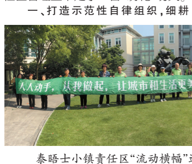
泰晤士小镇责任区“流动横幅”进社区活动

泰晤士小镇是一个集居住、旅游、休闲等多功能于一体的大型开放式社区。随着常住人口及游客人数的逐年攀升,乱停车、乱扔物、跨门经营等“乱象”层出不穷,加重了小镇的日常管理负担。近年来,方松街道对标最高水准、聚焦重点区域、凝聚多方力量、主攻薄弱环节,在小镇责任区管理上下足了一番“绣花”功夫。