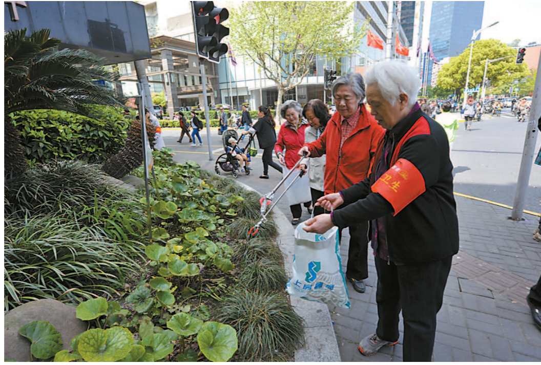
市民参与责任区环境清洁日活动

责任区制度的核心是“人人履行市容环境义务、人人享受市容环境成果”,因此,动员市民群众和社会力量共同治理城市,改变“多数人制造脏乱,少数人治理脏乱”的被动局面成为了各级管理部门的首要任务。为了深入宣传《办法》相关规定,营造社会良好氛围,各级管理部门每年组织开展百余场形式多样、贴近市民的主题宣传活动,通过展板宣传、发放宣传单页、开展有奖问答等方式,吸引市民的关注和参与。同时,在各大商圈的电子显示屏循环播放“责任区管理”宣传片,鼓励广大市民、沿街商铺及社会单位积极行动,广泛践行“我的门前我清洁,我的区域我负责”,共同营造整洁、美观、有序的市容环境。