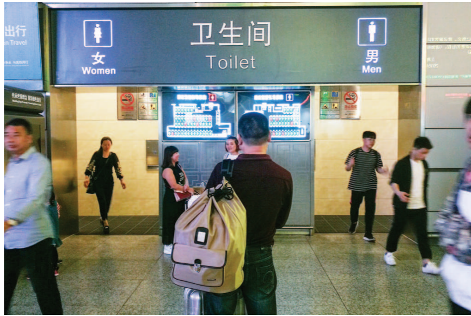
从节水、节能、低成本到物联网、人工智能,一场厕所革命正从更广阔的维度中展开。