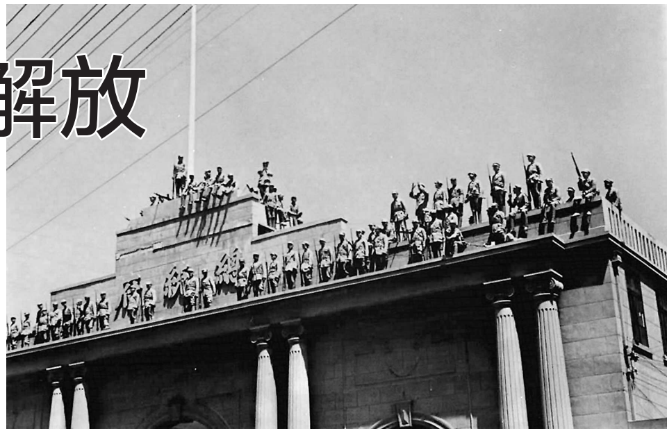
图为人民解放军占领南京总统府(资料照片)。

渡江战役一开始,35军便迅速攻克江浦、浦镇,23日上午,35军各师先后抵达浦口江边寻船渡江。午夜,当35军从挹江门进入南京市市区时,国民党军队早已逃之夭夭,南京已成空城。24日凌晨,解放军战士在起义警察及地下党组织的引导下冲进“总统府”,扯下青天白日旗。在“总统办公室”一张玻璃台面的大桌子