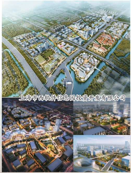
上海市西软件信息园投资开发有限公司