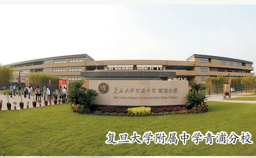
复旦大学附属中学青浦分校