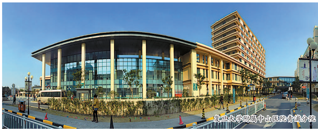
复旦大学附属中山医院青浦分院

文化底蕴激发自豪感。兼具传统与现代,以“古文化”和“水文化”为特色的会展游、购物游、生态游、文化游、古镇游、休闲游,是涵养身心、放飞心情的好去处。兼具雅致与时尚,世界顶级自行车赛事品牌—环意大利自行车赛携旗下赛事环境“Ride Like A Pro”已落户青浦,今年底开赛,这是拥有百年历史的环境品牌赛事首次在意大利以外国家举办。身心的愉悦感和交通的便捷度,让你我共享发展新机遇,共创城市新未来。