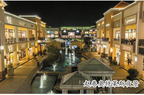
赵巷奥特莱斯夜景