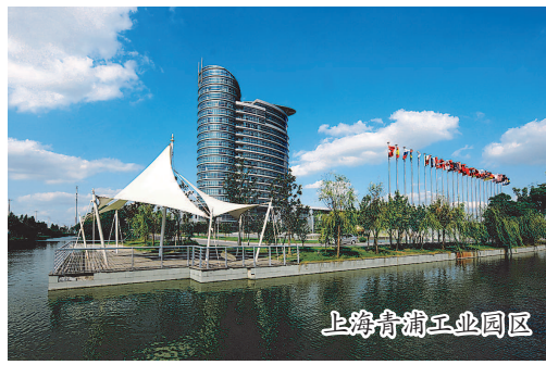
上海青浦工业园区

要素配置更加集中。围绕人才、资金、技术等核心要素的集聚和流动,积极搭建技术交易平台、人才服务平台,引进、培育和发展科技研发机构、科技中介机构、科技金融机构等,形成服务长三角、服务全国乃至亚太的创新资源集散地。