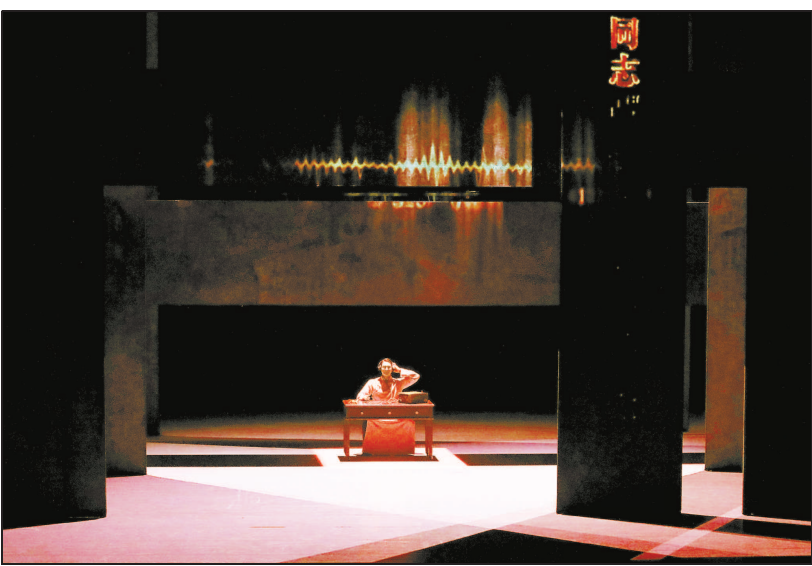
上海歌舞团原创舞剧《永不消逝的电波》剧照。5月20日，《永不消逝的电波》将作为第十二届中国艺术节开幕演出角逐“文华大奖”。