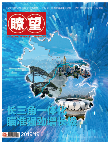
今年第19期《瞭望》周刊封面。

消费升级趋势明显，投资增速平稳回升，出口继续保持增长…… 中国经济韧性更足 “稳”的气质更凸显 刊3版▶