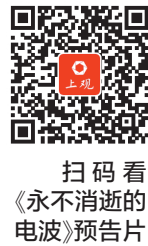
扫码看《永不消逝的电波》预告片

除了原创作品，一些红色题材的保留之作也经历新的打磨。在五月重新与观众见面。上海歌剧院音乐剧《国之当歌》，过去9年经过了150场锤炼，如今以更流畅的剧情、更精良的制作重回舞台。 下转▶7版