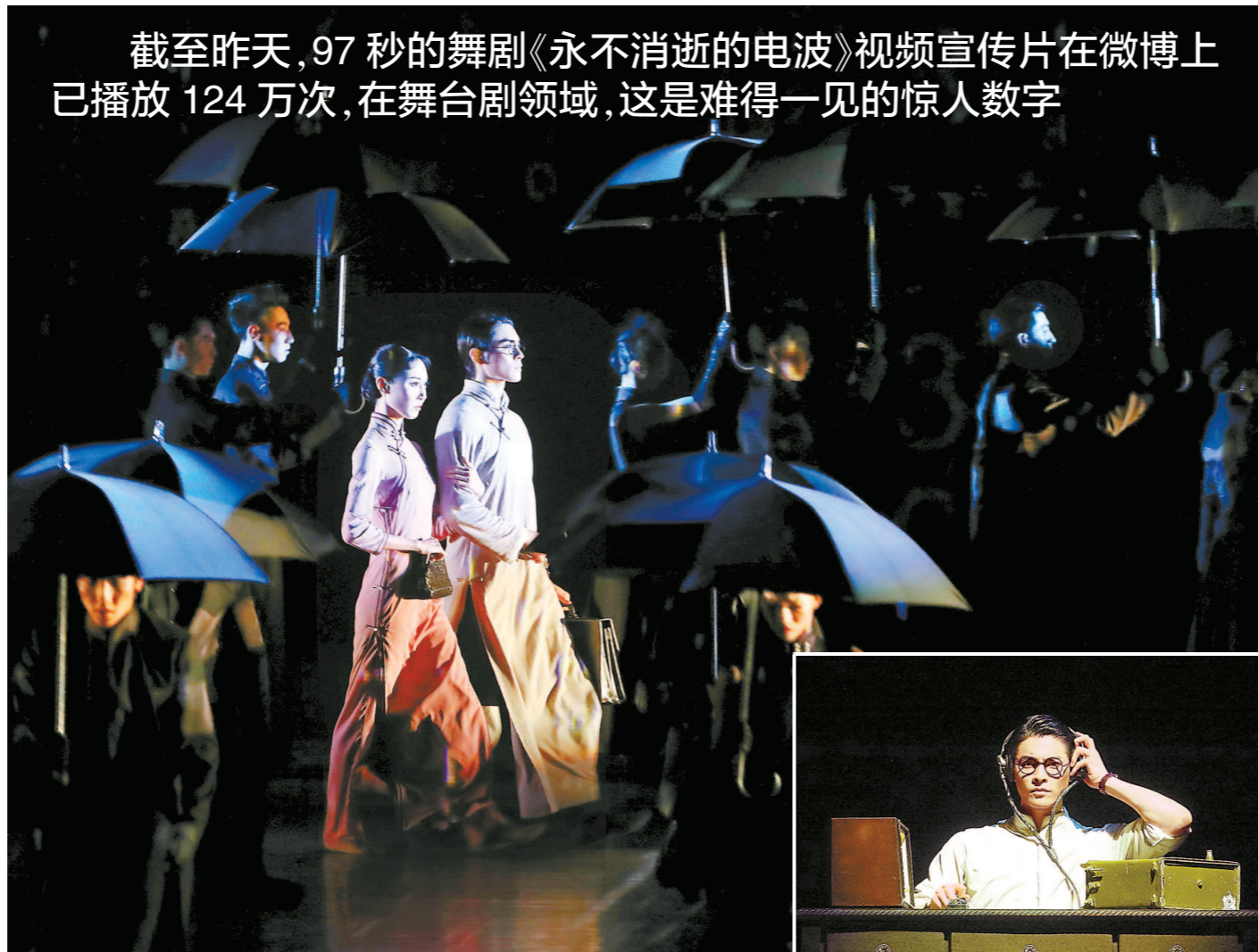
截至昨天,97秒的舞剧《永不消逝的电波》视频宣传片在微博上已播放124万次,在舞台剧领域,这是难得一见的惊人数字

本报讯(记者 谈燕)五月的上海,繁花似锦,艺韵悠扬,以“逐梦新时代——向国庆献礼,向人民汇报”为主题的第十二届中国艺术节5月20日晚在上海正式拉开帷幕。中共中央政治局委员、中宣部部长黄坤明出席开幕式并宣布第十二届中国艺术节开幕。中共中央政治局委员、上海市委书记李强出席开幕式。中宣部副部长、文化和旅游部部长雒树刚,上海市委副书记、市长应勇在开幕式上致辞。 十一届全国政协副主席、中国文联名誉主席孙家正,中宣部常务副部长王晓晖,全国政协常委、文化文史和学习委员会副主任王儒林,上海市领导殷一璀、尹弘、周慧琳、诸葛宇杰、宗明、张恩迪出席,文化和旅游部副部长李群主持开幕式。 雒树刚在致辞时说,第十二届中国艺术节是在全国上下喜迎新中国成立70周年之际举办的一次艺术盛会。在习近平总书记关于文艺工作的系列重要讲话精神指引下,新时代的广大文艺工作者紧紧围绕举旗帜、聚民心、育新人、兴文化、展形象的使命任务,坚持以人民为中心的创作导向,把提高质量作为文艺作品的生命线,努力攀登艺术高峰,谱写中华民族新史诗,艺术创作生产呈现出更加蓬勃繁荣的生动局面。我们要自觉承担起培根铸魂、守正创新的使命和责任,坚定文化自信,坚持与时代同步伐、以人民为中心、以精品奉献人民、用明德引领风尚,展现新担当,实现新作为,为实现“两个一百年”奋斗目标和中华民族伟大复兴的中国梦作出新的更大贡献。 应勇在致辞时说,本届中国艺术节在上海举办,是对上海的高度信任,是对上海加快建设“五个中心”和国际文化大都市的有力推动。我们要精益求精做好服务保障,努力奉献一届让人民满意、有国际影响力的艺术节。我们要以习近平新时代中国特色社会主义思想为指导,用艺术凝聚力量,搭好艺术节这座“大舞台”,让全国各地文艺工作者充分展示风采,为人民抒怀、为时代放歌;用艺术传承文脉,借助艺术节这座“连心桥”,加强与兄弟省区市的交流学习,进一步打响上海文化品牌;用艺术助力发展,做大艺术节这个“推介会”,展示推广更多精品佳作,助推文创产业高质量发展。 下转►5版