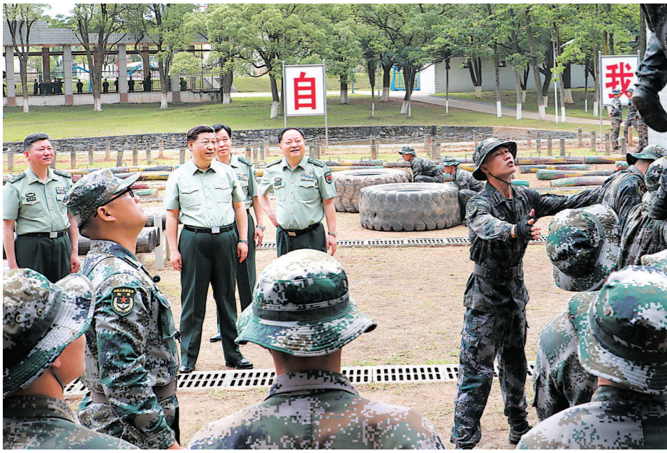
5月21日,中共中央总书记、国家主席、中央军委主席习近平到陆军步兵学院视察。这是习近平观看学员进行极限训练。