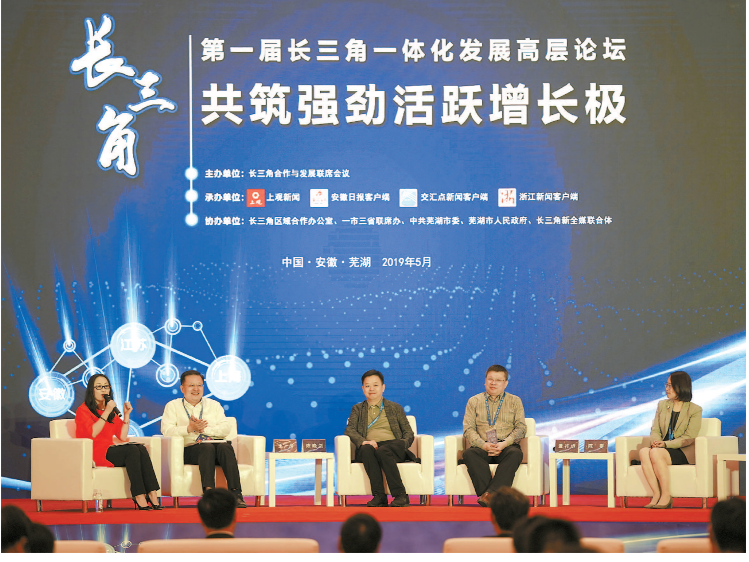
昨天,首届长三角一体化发展高层论坛在芜湖开幕。论坛圆桌讨论活动上,嘉宾就长三角一体化发展各抒己见。

作为本次长三角地区主要领导座谈会的首场活动,22日上午沪苏浙皖一市三省主要领导共同参与的首届长三角一体化发展高层论坛显得不同寻常,引人瞩目。论坛主题为“共筑强劲活跃增长极”,本就是长三角一体化的战略定位与题中之义。国务院参事、国家发改委原副主任徐宪平,民建中央副主席、上海市政协副主席周汉民,科大讯飞有限公司总裁刘庆峰等数十位长三角专家与企业家参与论坛。