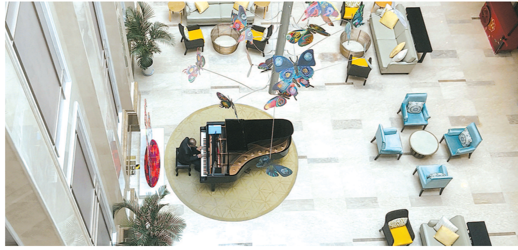
午后,一位老人在养老社区大堂里弹琴。

在松江这家养老社区门口,记者遇到一对手提帆布环保袋的老夫妻。上前询问得知,他们开园不久就搬了进来,当天正要出门买菜。如果平时不想烧菜,“去食堂就行了,一共四个食堂,四种菜系。”