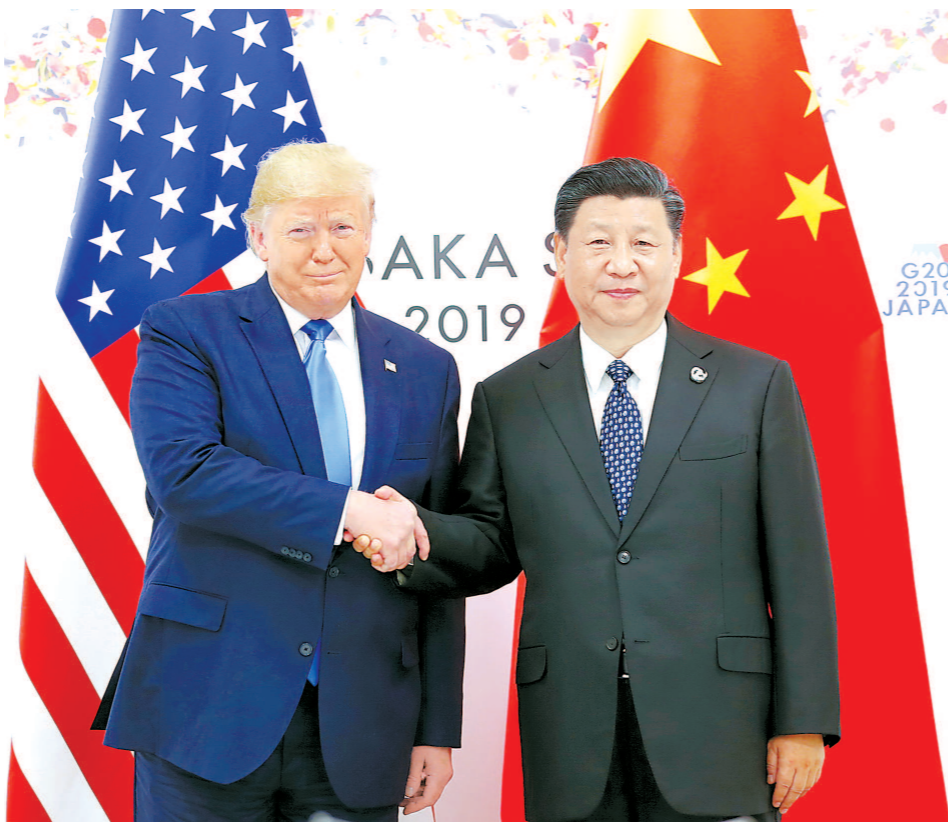
6月29日,国家主席习近平同美国总统特朗普在大阪举行会晤。