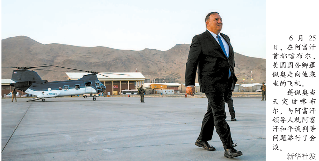
6月25日,在阿富汗首都喀布尔,美国国务卿蓬佩奥走向他乘坐的飞机。蓬佩奥当天访问喀布尔,与阿富汗和平谈判等问题举行了会谈。

事实上,在特朗普政府中,类似蓬佩奥这种疑似“假公济私”“公器私用”的行为几乎是一种“通病”。 仅此此前曝光的“包机门”(公款雇私人包机)就圈进了一拨高官,包括美国财政部长姆努钦、前环境保护局局长普鲁伊特、前卫生和公共事务部长普鲁伊特、前内政部长津克等。