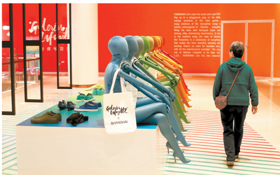
今年3月，老佛爷百货上海旗舰店试营业，不少顾客带着好奇心走进“老佛爷”。

台湾100家，日本的门店数则为700家。这意味着，届时，中国大陆将成为NITORI集团在海外最大市场，一举超过日本本土的店铺数。 无独有偶，除了NITORI集团，今年还有不少外资零售业巨头也在加码中国市场。6月7日，世界500强、德国零售巨头阿尔迪的中国首店正式落户上海；6月28日，世界500强排名第一、全球零售百强排名第一、沃尔玛旗下的会员制商超巨头——山姆会员店在青浦赵巷开出新店，这也是时隔9年后，山姆会员店在本市开出的第二家门店，也是全国第26家门店；8月27日，全美第二大、全球第七大零售商Costco中国首店也将将在闵行揭开面纱。 据山姆会员店中国业务总裁文安德介绍：“到2022年，山姆会员店开业（包括在建，即将开业）的门店总数将增加到40家—45家。这意味着未来3年，山姆会员店在中国市场上将进入加速跑阶段，从开业速度看，也是它在全球其它市场上所罕见的。” 下转►5版