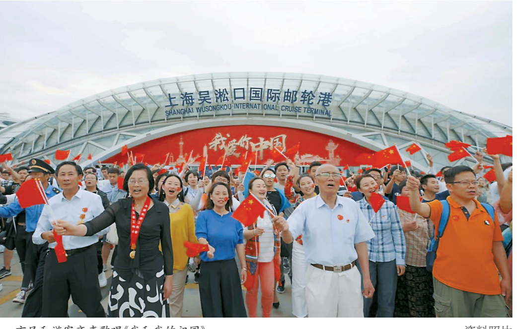
市民和游客齐声歌唱《我和我的祖国》。

《我和我的祖国》上海各区快闪MV展播活动由市委宣传部、市委网信办、市政府新闻办共同主办,上海广播电视台、上海报业集团、东方网承办,各区展播将在东方卫视等本市主流媒体播放,展播活动将持续至今年10月。