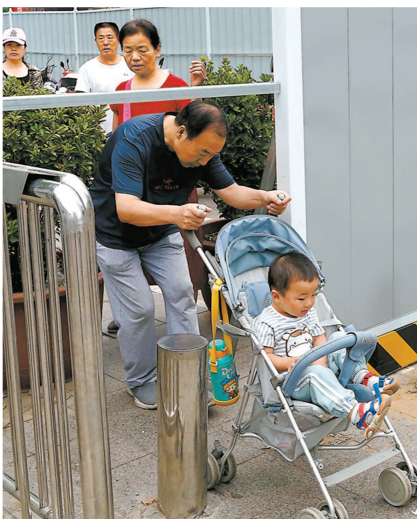
郑州人民公园东门设起围挡,老人低头弯腰从支架下钻过。