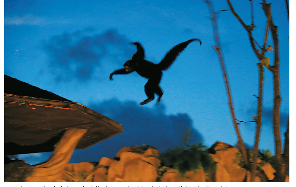
上周六晚,在夜间野生动物园,一只红脸蜘蛛猴在山林间“上蹿下跳”。