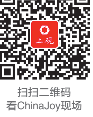
扫描二维码 看ChinaJoy现场

本报讯(记者 张熠)第17届ChinaJoy迎来大客流,前昨两日共接待入场观众超23万人次。除了大厂商的知名游戏外,一批由中小游戏团队设计的小而美的艺术游戏同样受到关注。