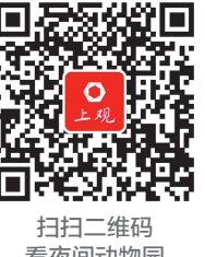
扫描二维码 看夜间动物园

除了世纪公园,上海植物园、辰山植物园以及分布在上海不同区域的生物基地,都在举办类似的自然教育活动。去年,上海植物园推出的40个“暗访夜精灵”名额上线3分钟即被一抢而空,世纪公园今年的480个夜游名额在开通第二天即全部告罄,还有家长抱怨抢不到。