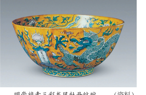
明崇祯素三彩龙凤牡丹纹碗。(资料)

本报讯(记者 施晨露)国家“十三五”出版规划项目《国家馆藏珍宝——中国陶瓷大系》(15卷)历经多年筹备及编辑,近日由上海人民美术出版社出版,将在今年上海书展亮相。