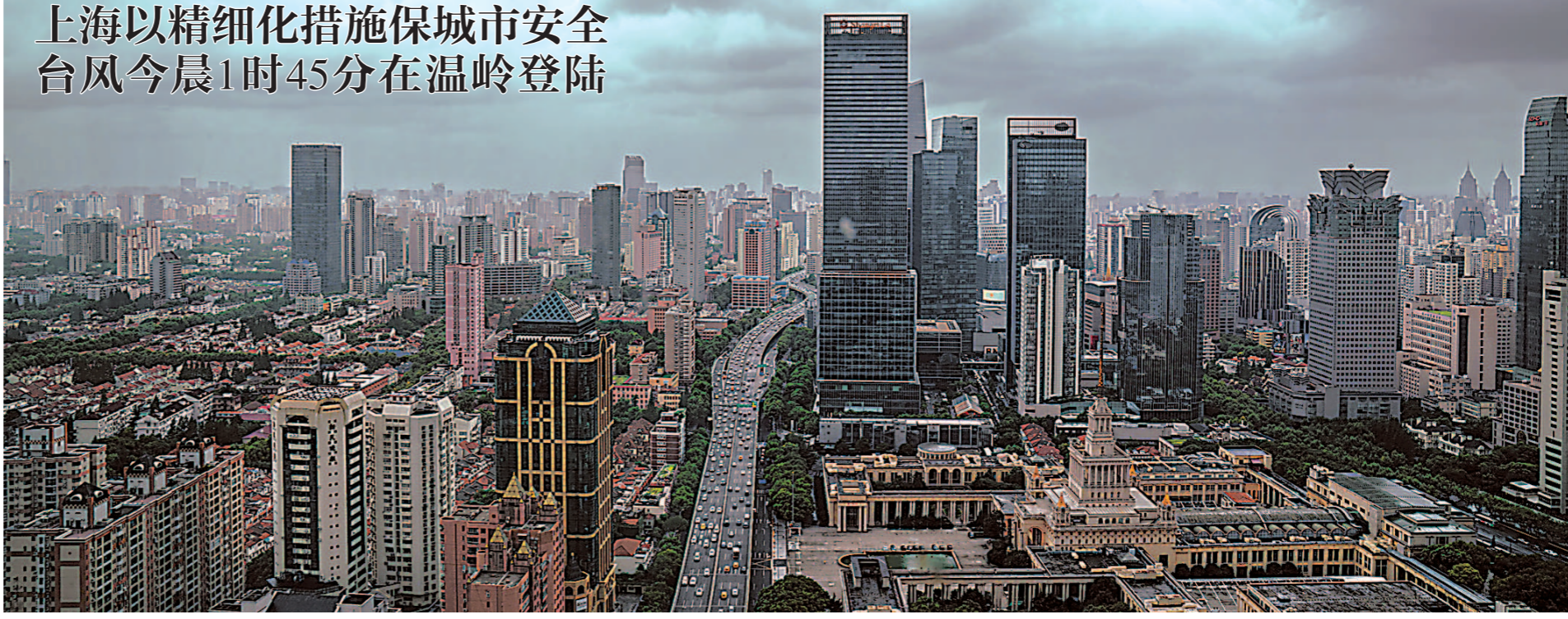
“利奇马”逼近，上海市中心黑云压城。因为台风来临前的延安西路上空。