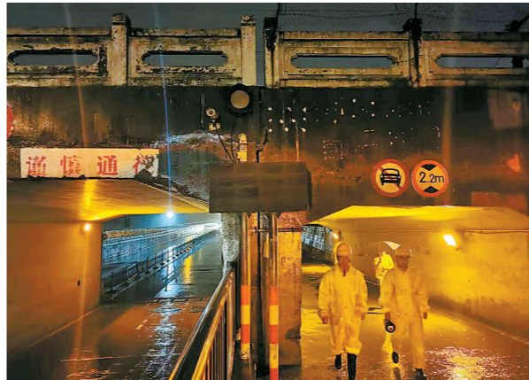
松江防汛抢险队员在联阳路立交巡查，防止积水，一直到警报解除。