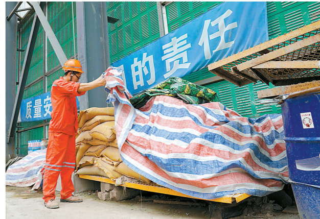
台风“利奇马”逼近，沪上工地停工。工人在检查防汛防台用的水泥沙包。