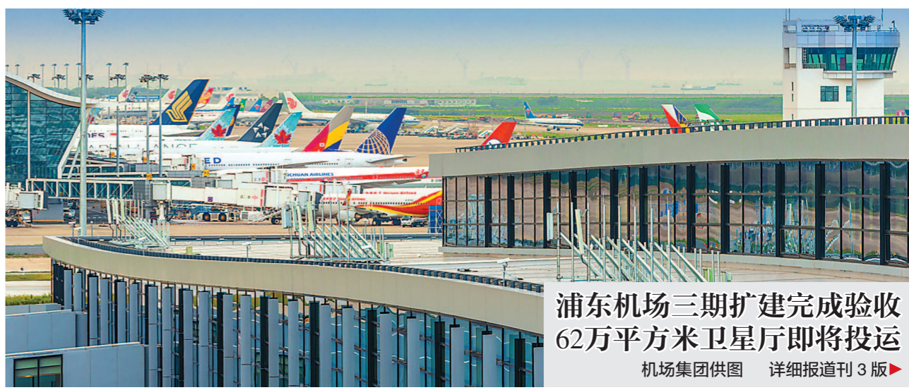
浦东机场三期扩建完成验收 62万平方米卫星厅即将投运 详细报道刊3版