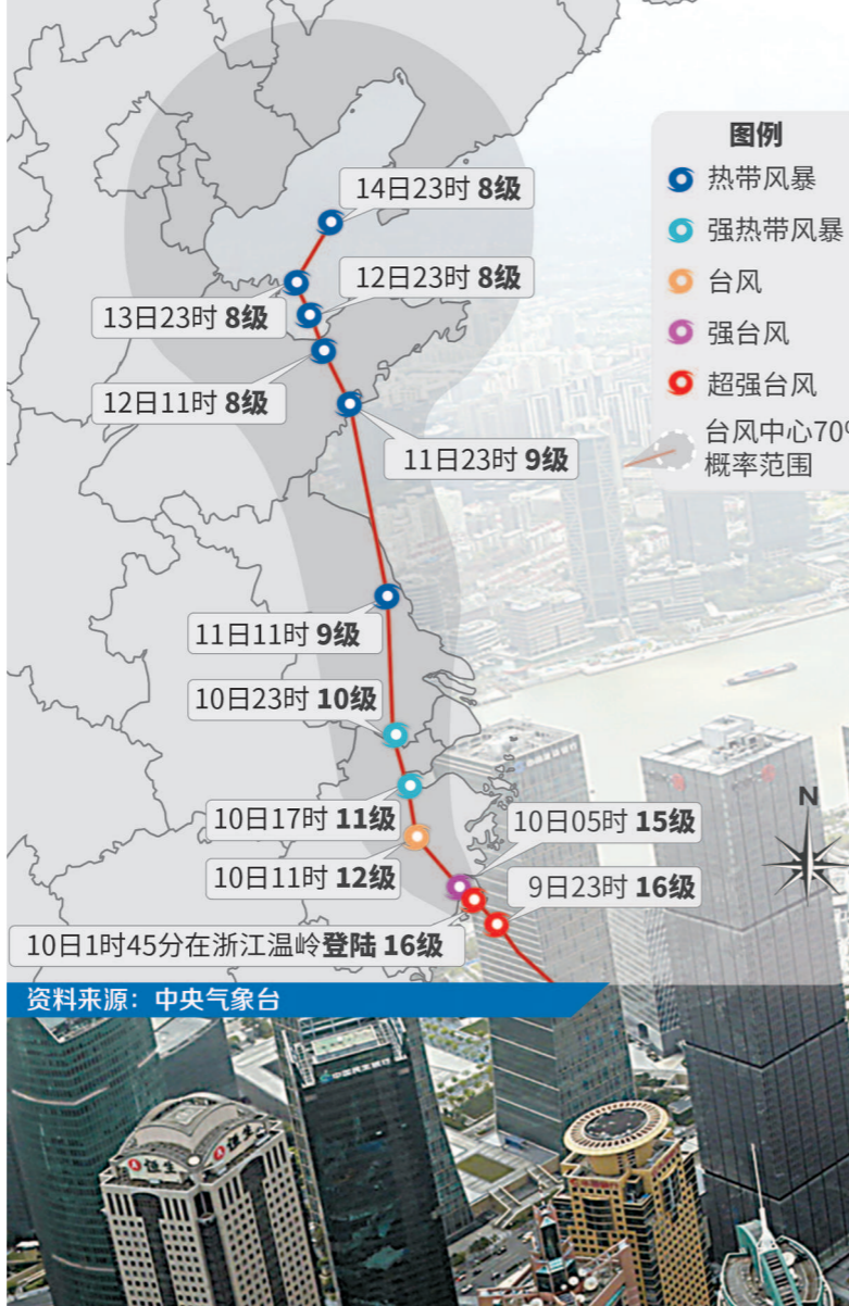
“利奇马”步步逼近中,昨日清晨拍摄的陆家嘴。