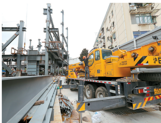
制图:王晨