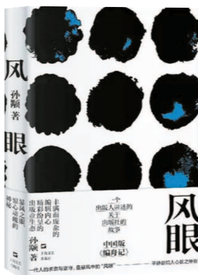
《风眼》 孙颙 著 上海文艺出版社

从万千编辑之中,你可以发现知识分子所有的色彩,金色、蓝色、红色、灰色,应有尽有……”作