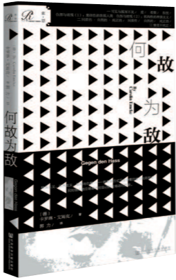
《何故为敌》 [德]卡罗琳·艾姆克 著 郭力 译 社会科学文献出版社

不宽容而引发的纷争和冲突,其共同根源都在于族群之间的集体仇恨。正如霍克海默和阿多