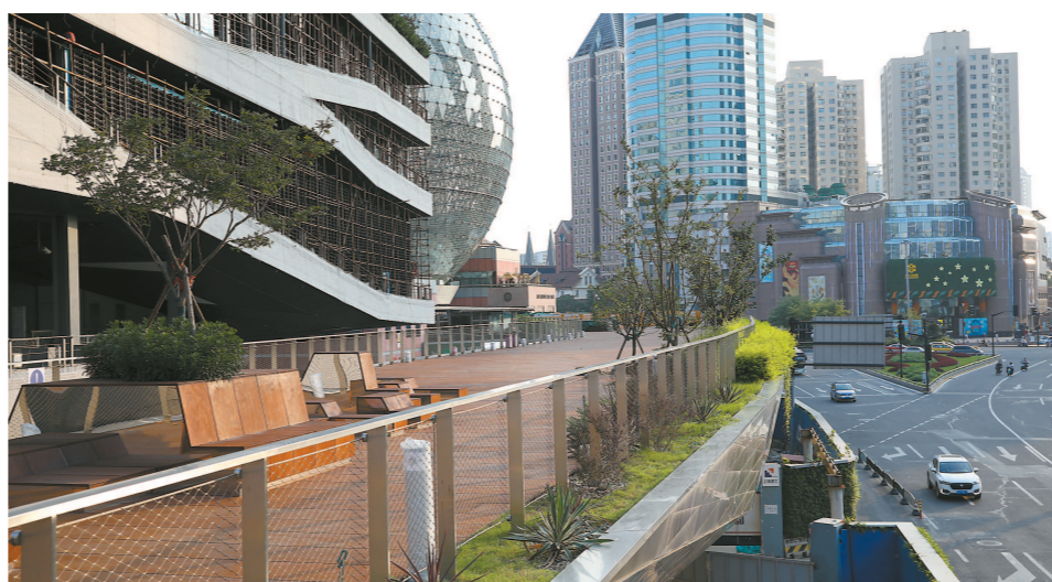
徐家汇空中连廊一期最快明年上半年开放

本报讯 昨天,根据市委、市政府领导批示,针对生态环境部(典型案例(4)上海振华集团环境违法问题突出群众反映强烈)中提出的问题,市生态环境局牵头成立专项督察组,进驻上海振华重工(集团)股份有限公司长兴基地(以下简称“振华长兴基地”)开展专项督察。专项督察组将通过资料调阅、现场检查、环境监测等方式对振华长兴基地进行驻点督察,全面检查振华长兴基地遵守国家和本市生态环境保护法律法规和标准规范及污染治理情况等,彻底查清振华长兴基地环境污染问题,提出处理意见并责令该企业拿出明确整改方案和时限,对于督察中发现的环境违法行为,将依法依规严肃处理。