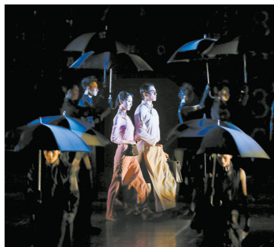
《永不消逝的电波》剧照。