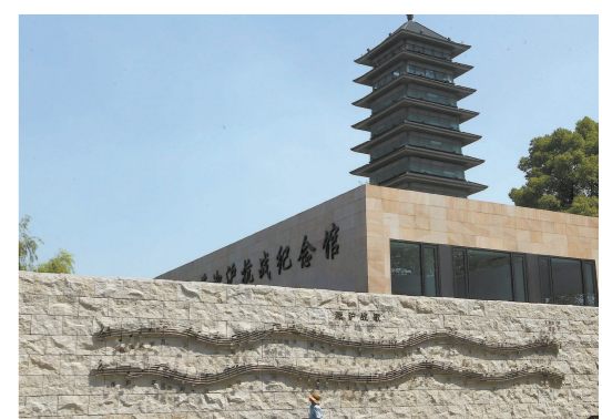
淞沪抗战纪念馆外景。

1995年8月13日,在淞沪抗战58周年纪念日之际,上海淞沪抗战纪念馆在宝山友谊公园内铺下第一块基石。上海市党政领导、抗战老战士和各界人士200多人出席了奠基仪式。