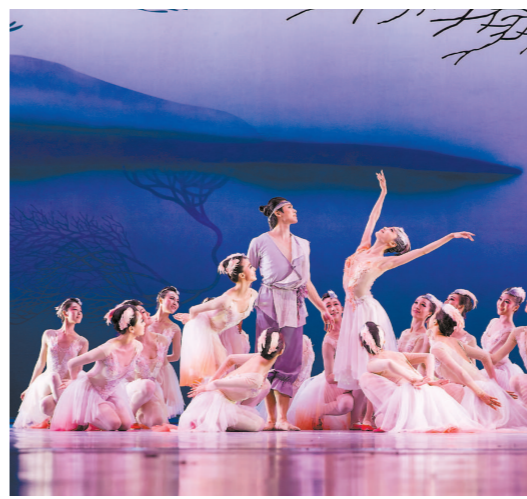
《朱鹮》剧照。

本报讯(记者 诸葛漪)“上海青年文艺家培养计划”工作总结会昨天举行。会议透露,培养计划启动4年来,43位培养对象中,近80余人次获省部级及以上国际专业奖项,如中国戏剧梅花奖、上海白玉兰戏剧表演艺术奖、中国曲艺牡丹奖、全国美展获奖、欧洲古典音乐大奖等。