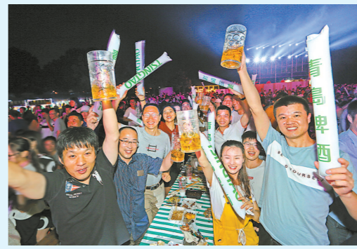
2019松江青岛啤酒节现场。