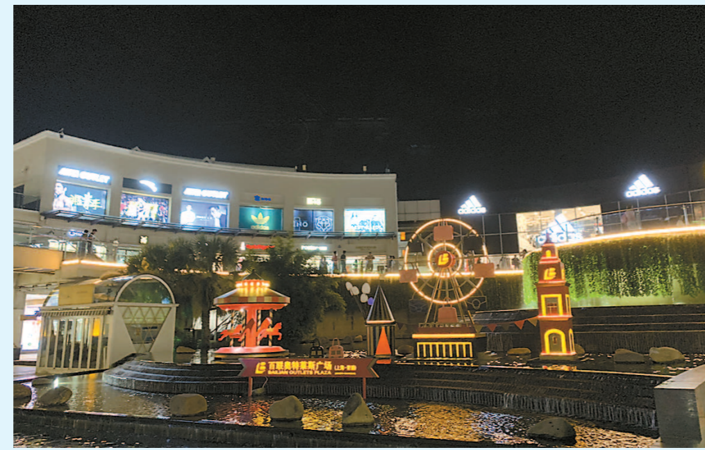
位于青浦的上海奥特莱斯品牌直销广场,入夜灯火通明。

郊区要怎么发展夜间经济?郊区夜市和中心城区有何不同?郊区的各种夜市面,会有人捧场吗?交通等配套如何跟上?带着这些问题,记者调查走访了青浦、松江、嘉定、闵行等地一些夜间经济点位。