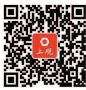
扫二维码 感受沪郊热闹夜市

中,住户存款减少1032亿元,非金融企业存款减少1.39万亿元,财政性存款增加8091亿元。从货币供应看,7月末,广义货币(M2)余额191.94万亿元,同比增长8.1%,增速比上月末和上年同期均低0.4个百分点;狭义货币(M1)余额55.3万亿元,同比增长3.1%,增速分别比上月末和上年同期低1.3个和2个百分点。同日发布的社会融资数据也显示,7月末社会融资规模存量为214.13万亿元,同比增长10.7%。7月份社会融资规模增量为1.01万亿元,比上年同期少2103亿元。