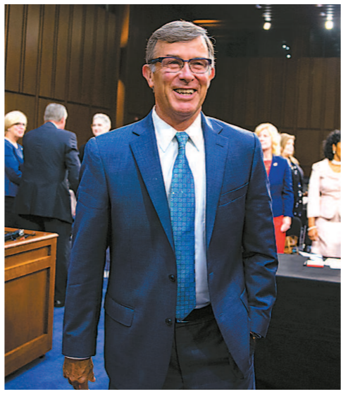
7月25日，美国国家反恐中心主任马奎尔在国会作证。他将担任代理国家情报总监。

特朗普与美国情报机构曾围绕伊朗、朝鲜、俄罗斯干预美国大选等问题明争暗斗。随着科茨、戈登离职这一最新动向，国家安全官