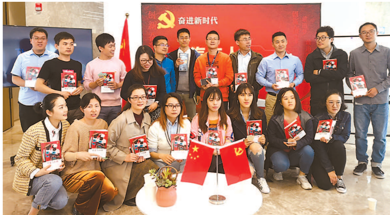
安亭汽车创新港党群服务站开展的党员创新说之读书分享会活动。

嘉定是民营经济高度发达的区域,全区有3个市级工业园区,33个私营经济小区。近年来,又建成了中广国际等21个服务产业园区,南翔精准医学产业园等新兴产业集聚区也已初具规模。在这些园区中,集聚了大量非公企业和高层次人才,园区已经成为嘉定推动产城融合、加速创新转型的重要引擎,也是推动嘉定城市建设、社会治理的重要力量,更是深入推进非公企业党建的重要阵地。嘉定区以园区党建为抓手,在健全工作机制、丰富平台项目、履行社会责任等方面整合资源、聚焦发力,走出了一条新时代非公企业党建的新路径。