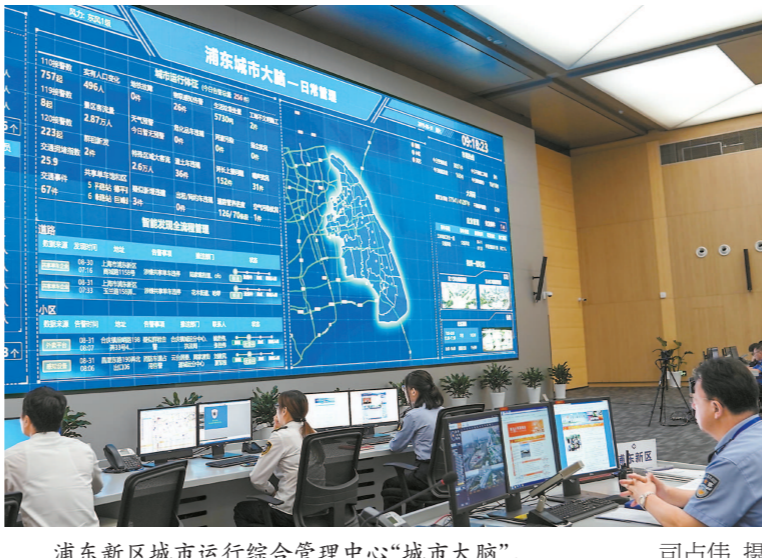
浦东新区城市运行综合管理中心“城市大脑”。

■习近平总书记强调,城市治理是国家治理体系和治理能力现代化的重要内容。一流城市要有一流治理,要注重在科学化、精细化、智能化上下功夫。既要善于运用现代科技手段实现智能化,又要通过绣花般的细心、耐心、巧心提高精细化水平,绣出城市的品质品牌。上海要继续探索,走出一条中国特色超大城市治理新路子,不断提高城市管理水平