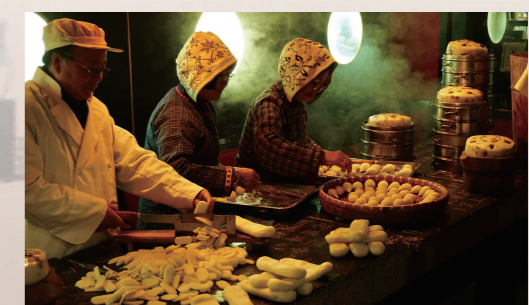
宝山“鞋底”年糕制作技艺