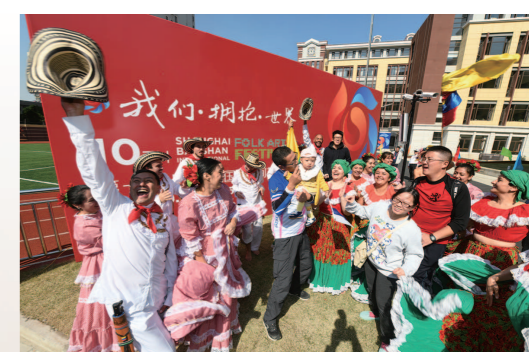
上海宝山国际民间艺术节