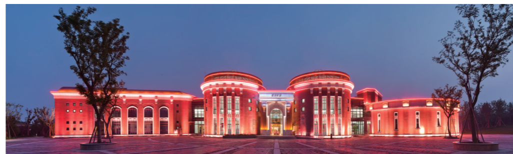
上海宝山国际民间艺术博览馆