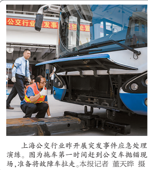
上海公交行业开展突发事件应急演练。图为拖车第一时间赶到公交车抛锚现场，准备将故障车拖走。

系统后，通过人工智能技术对驾驶员面部动作、驾驶行为状态进行实时监控，系统发现不规范操作和驾驶行为，及时推送至营运线路调度室、公交车队监控中心、调度员、监控人员进行甄别确认后，会通过驾驶座安全头枕里的音响发出“请注意安全”“请规范操作”“请专心驾驶”等语音示警。 目前，线路上推行的安全提醒主要应用于三方面：营运车辆停靠示范站点时进行规范停站提醒；营运车辆进入相关重要路段、重要路口、重要站点时进行安全提醒；营运车辆进入路口超速时进行安全提醒。