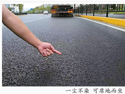
一尘不染 可席地而坐

今年，在巩固第一届进博会保洁成效的基础上，新增延中绿地地区、徐家汇商业区、枫泾古镇、朱家角地区、长风生态商务区(中江路(光复西路—云岭东路)、丹巴路(光复西路—云岭东路))、北外滩区域、吴淞码头地区等7个重点区域达到“席地而坐”的保洁标准。此外，黄浦江滨江45公里岸线精细化保洁区域也由原来的黄浦区段拓展到包含黄浦、徐汇、虹口、浦东四区的大部分岸线。