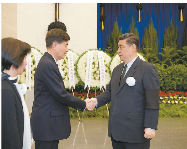
习近平与丁石孙亲属握手,表示深切慰问。