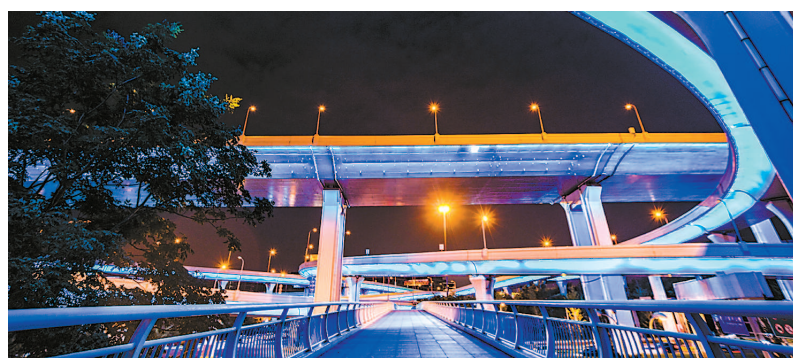
嘉闵高架景观灯光

同时，闵行区还按照首届进博会席地而坐的标准，提高道路清扫和冲洗频次，确保的展会期间道路更加整洁。