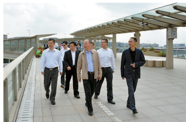
区领导检查进博会周边社会管理情况

此外，闵行区举办了消防综合救援演练、公交车疏散灭火演练，以及严重精神障碍患者肇事肇祸应急处置演练等演练工作，并将于近期举办危化品险情处置演