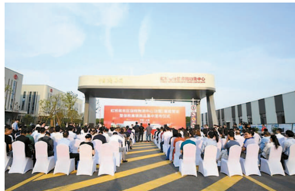
保税物流中心建成仪式

闵行的招商接待工作始终把放大和承接进博会溢出效应作为重点。目前，相关部门已筛选建立以世界500强企业、行业龙头企业、产业链上游企业为重点的“1500家重点招商信息库”，根据闵行4+4产业规划，结合各街镇（园区）的产业特点，将1500家企业进行精准分配，各镇、园区会前进行招商对接，会中实施项目专人跟踪，会后项目对接情况纳入重点招商项目进行闭环管理。