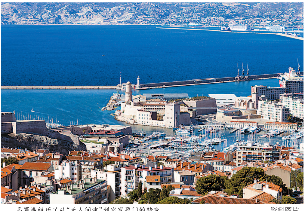
马赛港经历了从“无人问津”到宾客盈门的转变

2013年对于马赛港的发展具有突破性的意义。作为邮轮港口,它不仅奠定了其在法国国内地位(现已跃身成为法国第一大港),并且得以跻身地中海区域众多知名港口之列——成为邮轮公司规划线路中几乎绕不过去的港口。马赛港的发展得益于地中海流域的吸引力和欧洲市场的发展。更广泛地说,是得益于地中海区域的旅游获得的巨大发展。地中海流域由同名海域构成,与黑海相连,是目前第二大航行流域,仅在加勒比海之后。目前,所有邮轮公司都有邮轮在地中海区域航行,尤其是在夏季。马赛港发展依托的第二要素是欧洲邮轮游客人数的增长。2002年至2012年,欧洲邮轮游客人数增长率达到162%,而世界市场平均增长率为89%。欧洲和地中海区域的港口主要吸引欧洲顾客群。2012年,共有570万乘客从欧洲港口登船进行海上邮轮旅游。这一顾客群大多拥有欧洲国籍,仅有90万乘客来自欧洲以外的国家。