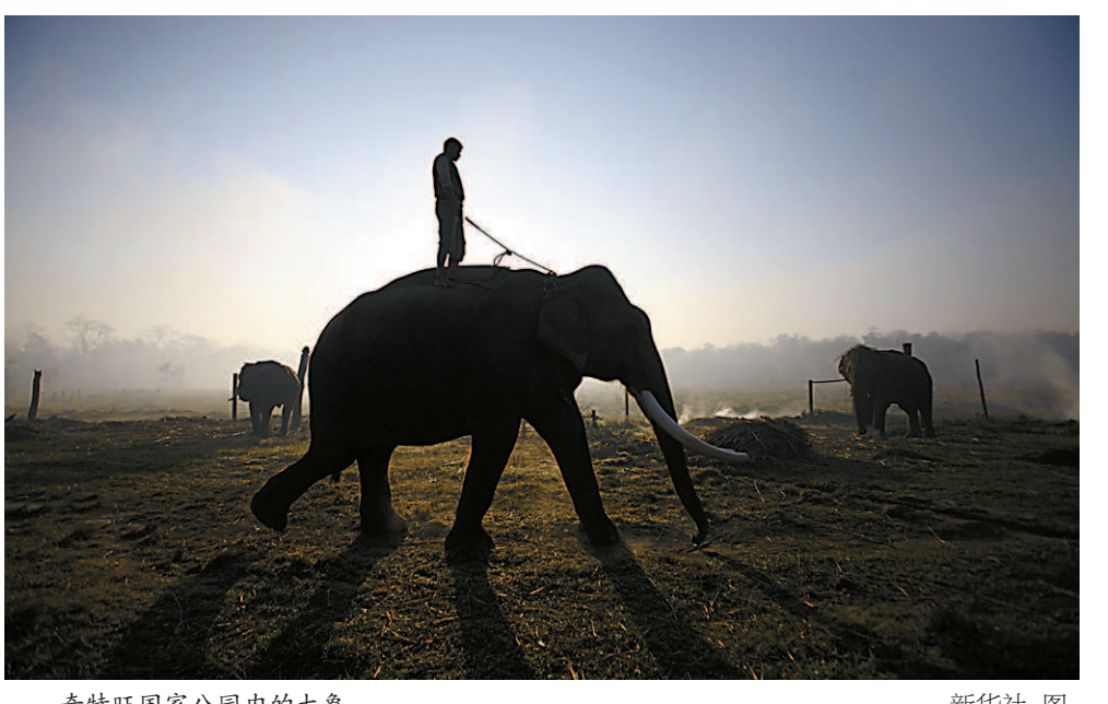
奇特旺国家公园内的大象

尼泊尔南部是宽广的平原,河流在此形成冲积扇,滋养了肥沃的沃土,从而衍生出一大片的野生动物栖息地和葱郁的丛林。在尼泊尔语里,“奇特旺”是“丛林之心”的意思。奇特旺这个地区和它的一片土地一样,充满了自然之乐:各类野生动植物在这里和谐相处。作为尼泊尔乃至亚洲地区保存最完整的一片原始森林,奇特旺国家公园里生活着多达数百种的珍稀动物,被誉为“生命方舟”。在19世纪,那里是专供尼泊尔和外国贵族狩猎的猎场。最为轰动的一次猎杀是1911年,英王乔治五世及其子爱德华八世杀死了39只受伤的老虎和10只犀牛。到20世纪60年代中期,那里的犀牛和老虎数量分别降到了不足100只和20只。野生动物急剧减少的消息传到当时的国王马亨德拉的耳朵里,他遂宣布该地为皇家保护区,并于1973年建立了奇特旺国家公园。当时,约22000名农民从公园所在地迁出,但直到军队巡逻员进入公园内阻止偷猎之后,野生动物的数量才开始有所回升。作为尼泊尔第一座国家公园,奇特旺国家公园一直免费对外开放。每年10月份到次年的3月份,是游览奇特旺国家公园的最佳时段。现在,人们喜欢到那里观察野生动物和自然环境,享受户外活动的乐趣。如果时间较紧,游客通常会选择由当地专业向导带领,游玩半天。如果时间充裕,人们则会留出一两天甚至