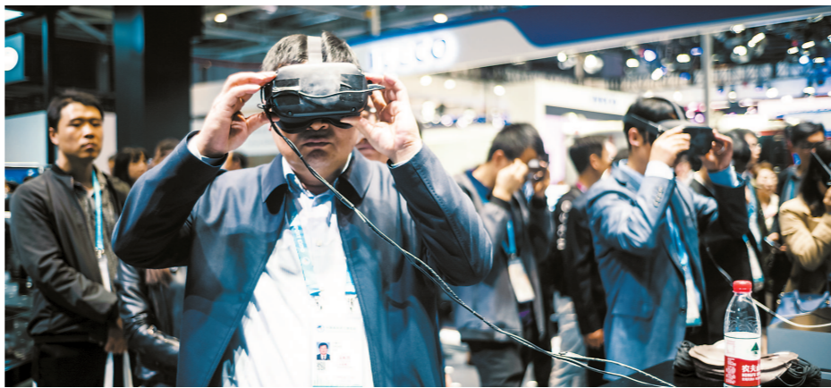
韩国现代汽车展位成为进博汽车馆“流量王”。大家都争相排队，通过 VR 眼镜一探车内究竟。

从第二届进博会展品物资总量看，大大超过去年首届，但今年许多展商的展品却“姗姗来迟”。专业人士分析，去年进博会展品赶早，主要是因为一些企业还不了解上海的通关环境，宁可提前进境。但事实上，上海的营商环境超越了参展商的期待，因此今年大家更为从容。像前面提到的蓝鳍金枪鱼，4 天前刚在地中海捕捞出水，正是这层新鲜感，又为它增添了不少人气。其实这背后，是上海“即到即通关”服务带给展商的一份从容。