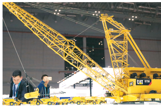
美国生产的吊斗铲车价值二亿美元，中国到目前为止引进了一辆。此车模型亮相进博会。