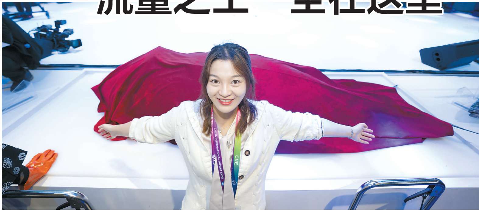
红布下净重 255 公斤的蓝鳍金枪鱼长度相当于女生的臂展。