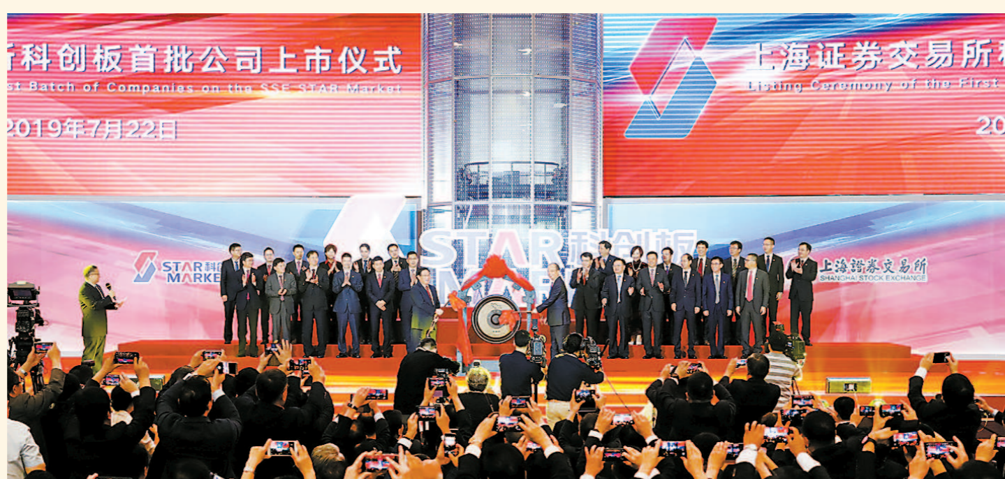
7月22日,上海证券交易所举行科创板首批公司上市仪式。