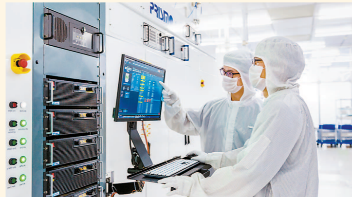
中微公司研发人员在工作。