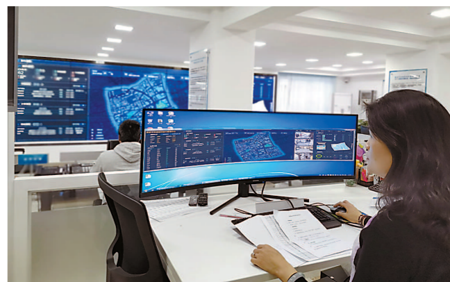
街道建设智能“一张网”，实现基层治理提质增效

如今，已有600余名外企党员加入“Call Me 党员”行动。欧莱雅公司开展“Call Me 党员公益日”，卫材药业公司开展“Call Me 党员领跑行动”，两家公司党组织都获评了市区先进基层党组织及党支部建设示范点。而在更多的外企中，党员也都亮出身份，争做示范，使党建成为推进企业发展的“红色引擎”。