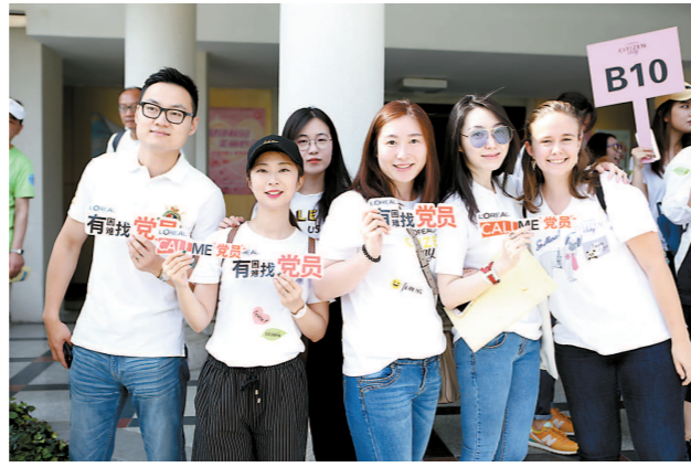
外企党员亮出“Call Me 党员”标识参与社区公益