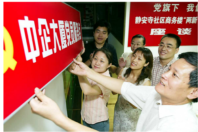
2002年5月，上海第一个商务楼宇党员服务点在中企大厦挂牌成立