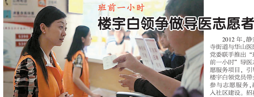
白领志愿者为患者提供导医咨询服务

“换栏杆”项目完成后，以前只是点头之交的居民也变得亲热起来，遇到大小事，大家都能协商共议。大家都说：“‘新闻居民’将商品房又住成充满温情的老弄堂了。”