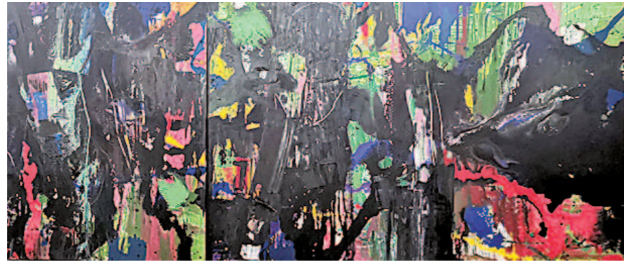
李磊《水问》(局部)2019,布上丙烯

《水问》要表现是一种雄健的气质,水是柔弱、潇洒的,而当水流汇聚在一起的时候,就形成了大江大河的气派。