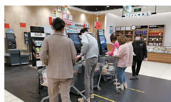
宝乐汇商场内居民有序购物

与此同时，把商务领域重点企业的问题困难和意见诉求及时收上来，及时把政府的关心支持送下去，通过帮助企业解决实际困难，切实减轻疫情防期间企业负担。如区商务委指导正大食品、卜蜂莲花、三航奔腾、莱歌研磨等企业申办与疫情相关的事实性证明；协调有关镇园区，为市场订单足、涉及防疫物资生