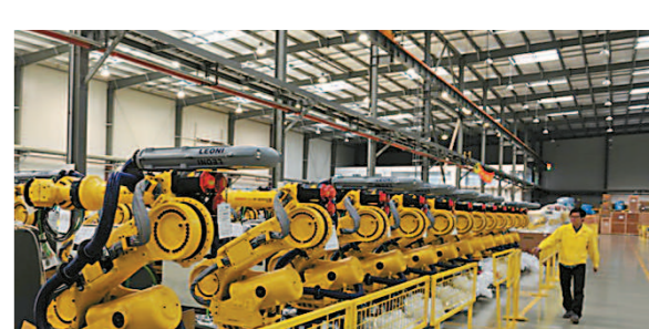
上海机器人产业园内的发那科车间

产和重要供应链的企业加快复工复产审核。宝山区也充分利用外资、外贸、重点载体等企业微信群平台，“线上+线下”双线宣导，积极做好抗疫惠企政策宣传和解读，及时发布“上海惠企28条”、“宝山惠企8条”政策及相关实施细则。同时，强化提供云空间零距离咨询服务，区商务委、区发改委（金融办）和中国银行宝山支行联合举办“银政携手，共渡时艰”支持企业复工复产网上直播宝山专场活动，通过新潮的宣传方式深入做好惠企政策指导，提供金融支持措施，向包括重点商务领域企业在内的1300多家企业答疑解惑。据了解，通过这种方式宣传复工复产政策及措施在全市属首家。