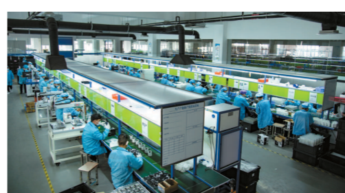
小卫科技复工复产