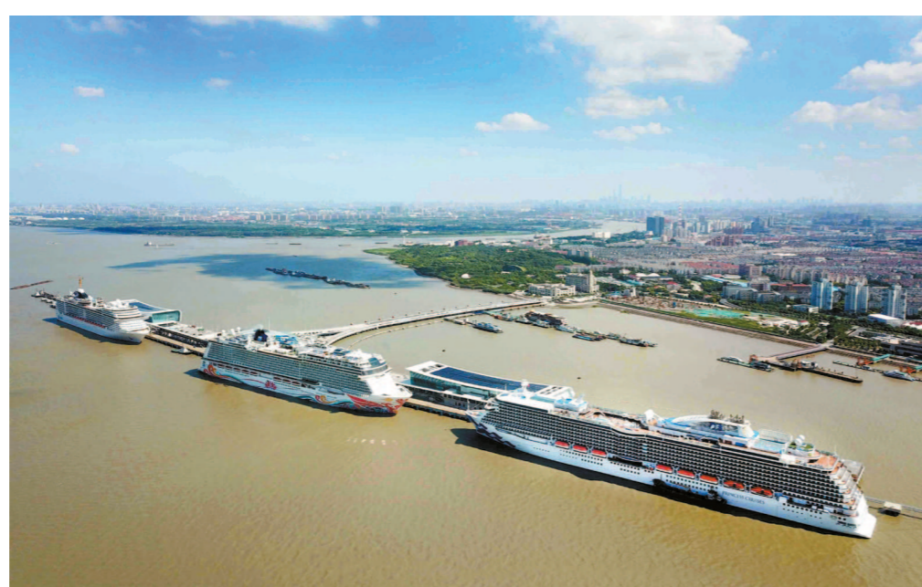
吴淞口国际邮轮港

日前，宝山区坚持统筹推进疫情防控和经济社会发展两手抓、两不误，全力以赴应对这一场艰巨战“疫”。2020年，宝山区共安排重大产业项目78个，涉及总投资近1200亿元，占地近1万亩，建筑面积650万平方米，当年新增投资近300亿元，项目数同比增长170%。经测算，2020年开工类项目34个，总投资约248亿元，开工类项目平均投资强度达到623万/亩；在建类项目20个，其中11个力争年内竣工。目前，宝山区规上生产企业、产值亿元以上生产企业、“专精特新”中小企业均已全部复工。