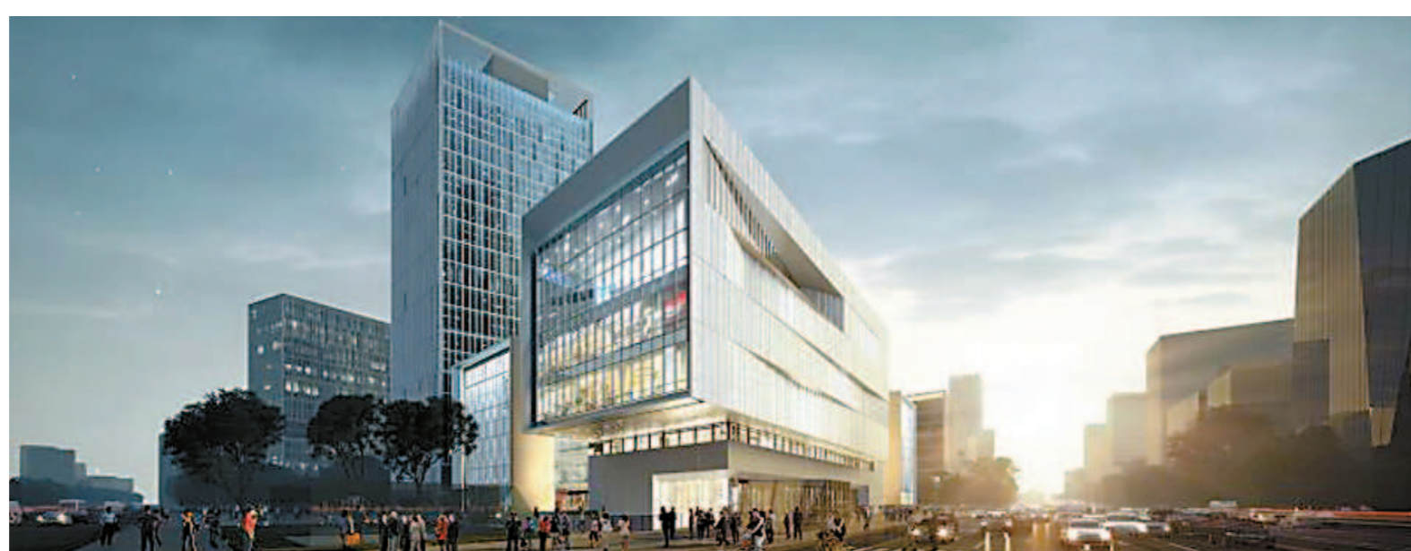
南大地区规划效果图

通过“宝山区疫情防控政策服务平台”，全方位地为使用者提供在实时疫情相关政策和政策咨询。帮助中小企业抗击疫情、共渡难关，缓解本区科技型中小企业资金压力，制定科技型中小企业技术创新资金补贴、科技创新券补贴、科技企业孵化器补贴和创新产品研发攻关奖励等政策。