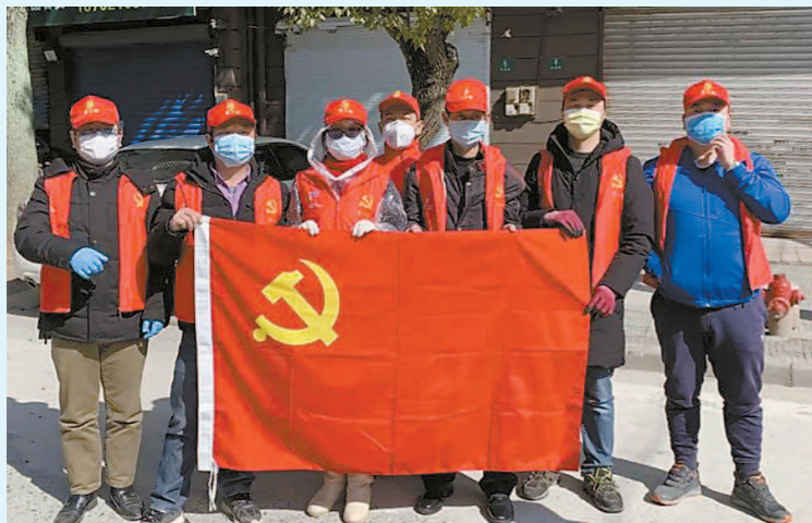
党员志愿者助力社区疫情防控。