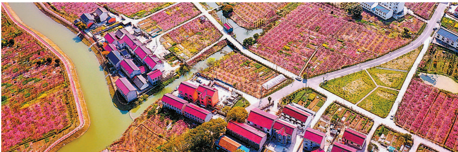
吴房村十里桃花怒放。

的驻企店小二了解情况后，立刻协调了奉贤海关帮助企业报国家海关总署特批，问题的解决比预想得更快，企业顺利完成了这单生意。 记者了解到，到目前为止，驻企店小二通过实地走访、电话调研的形式，共解决企业复工复产问题数百个，其中包括合资企业运往黄浦公司跨省产业链包装容器提前开工供应；熔喷布材料供应商大韩道恩公司融资诉求；上海麦宝实业有限公司、上海泛洲建筑安装配套有限公司等20多家外资外贸企业复工、进出口、资金流、原材料问题等，让企业真正回到发展的正轨上来。