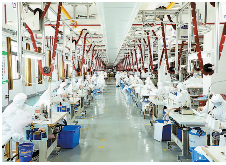
美迪科公司赶制医用防护服。