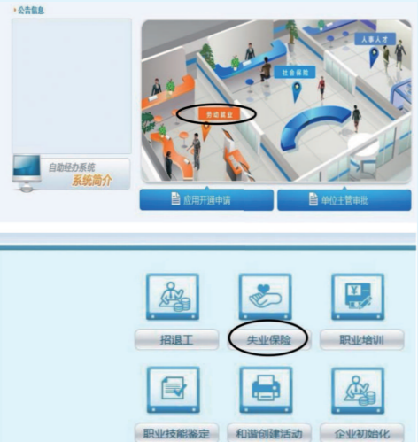
失业保险稳岗返还申请线上申请界面

本市阶段性减免企业社保费政策出台后,为不增加企业事务性负担,市社保中心已采取措施,包括对信息系统做相应的调整,同时暂缓政策实施准备期内企业社会保险费的申报缴纳工作。由于本市社保费征收实行的是“当月申报,次月缴费”,企业2月份应缴纳的社保费,已于3月份暂缓申报缴纳。