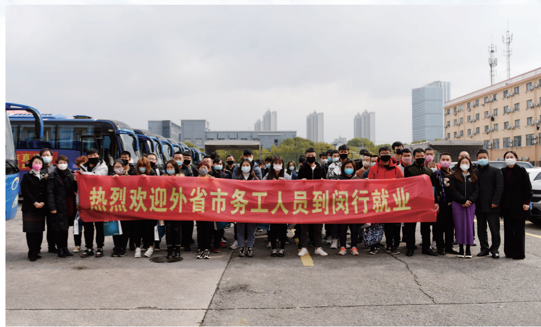
闵行区为安费诺永亿公司从云南和遵义贫困地区招募到94名员工,员工接到上海后,区人社局及时送上了防疫物资

3月5日,闵行区开展了2020年大型线上春风行动活动,通过“闵行就促”公众号开展“云招