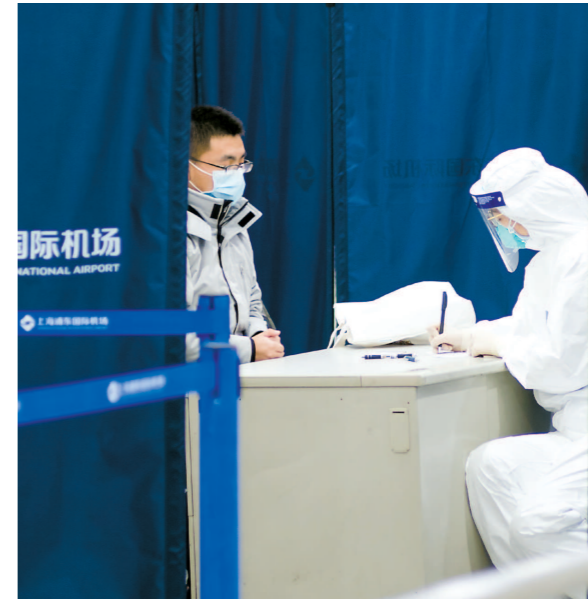
外防输入 在浦东机场,海关关员为旅客查验。