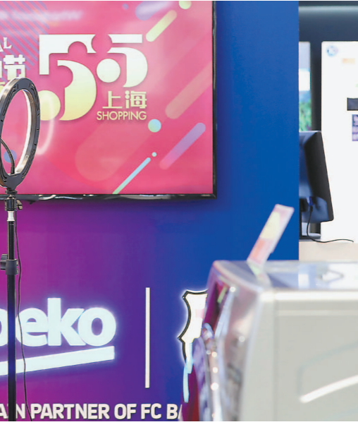
提振消费 在“五五购物节”期间,各大商场线上线下全场景直播带货。

经过响应和筛查两道关后,考验的是医疗救治能力。疫情发生至今,上海所有确诊患者均由负压救护车转运至定点医院救治,实行分类救治,并对重症病例实施“一人一方案”。得益于集中优势资源,以及高级别专家组和多学科诊疗团队,上海的确诊病例治愈率一度高达97.5%,并且医务人员零感染。 外部防疫形势的不断变化,防疫举措要因时因势而变。3月初以来,“外防输入”压力陡增,上海迅即构筑起一道从机舱门到家门到社区的防护闭环;4月以后,任务又加上了“内防反弹”,及至进入常态化疫情防控的新阶段,上海又进一步明确要守好“入城口”,抓住“落脚点”,管好“流动中”,服务“就业岗”,看好“学校门”,用好“监测哨”……从监测预警到集中救治再到社会动员,贯穿始终的关键词,一个是精细,一个是精准。 当然,这场大考,也暴露出上海尚存在的短板。有识之士发问:如果疫情再次发生,甚至严重数倍,上海该如何应对? 长效的制度供给由此被提上日程。