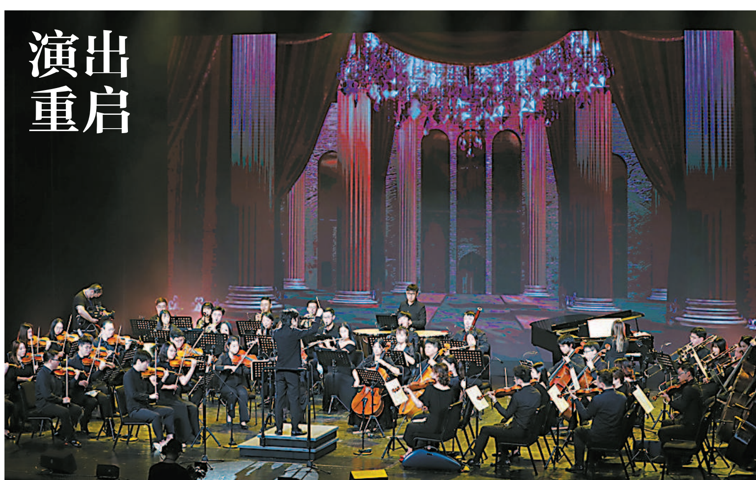
“浪奔浪涌·艺路向东”公益演出举行,彩虹室内乐团演奏交响乐《创意贝多芬》。