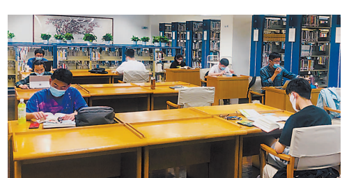
阅览座席按防疫要求保持距离。

本报讯(记者 施晨露)昨天是上海图书馆恢复阅读服务第一天。中午时分,记者走进上图发现多个阅览室“满员”。由于座椅间距较大,且多为二席一人,总体秩序井然。