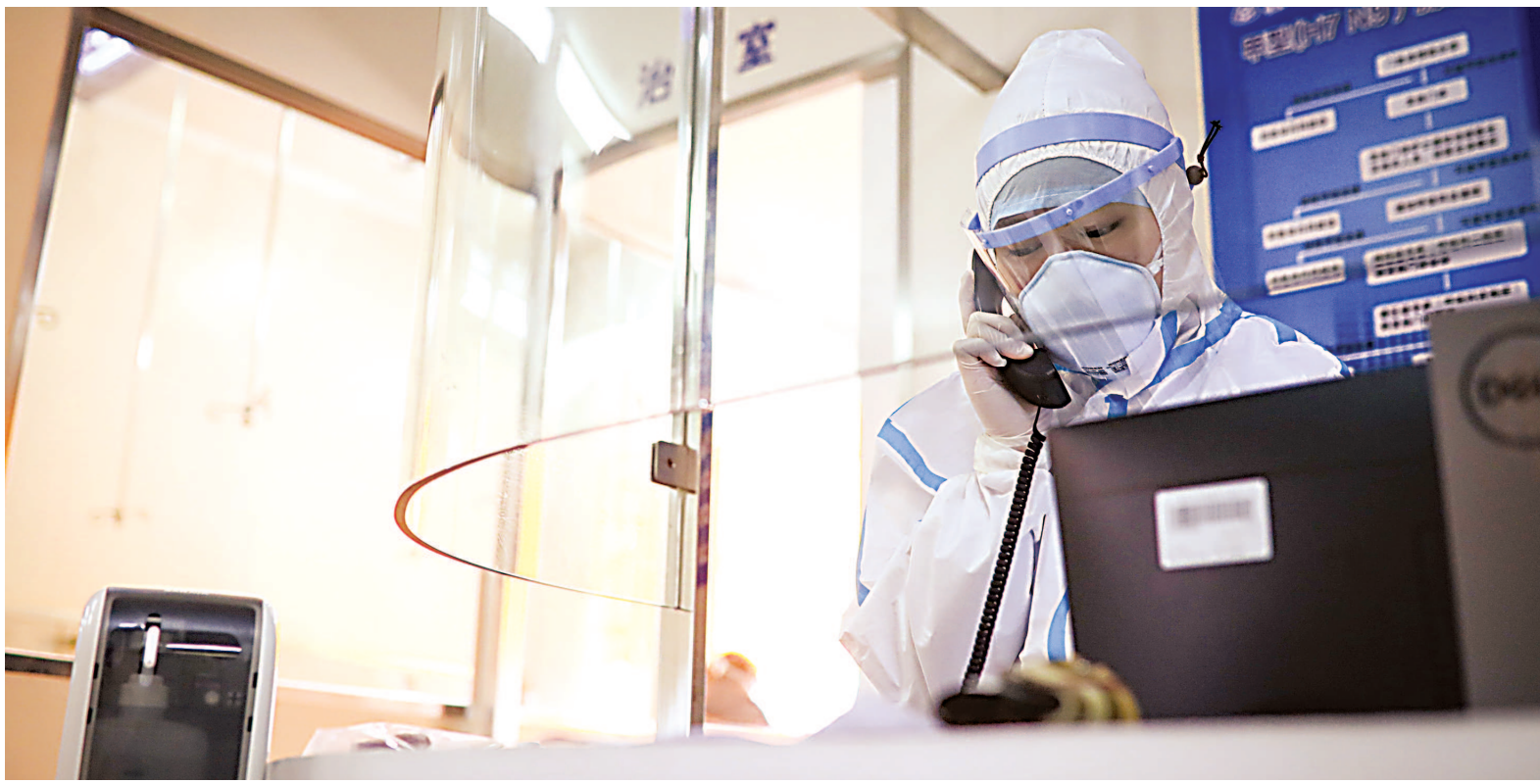
上海一家医院的发热门诊护士。