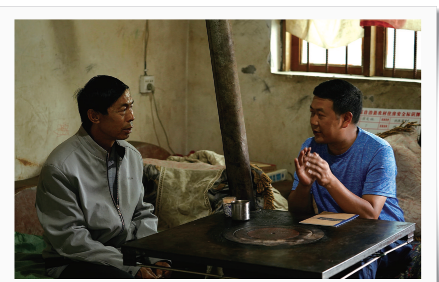
茅台驻村干部走访贫困户

2019年8月30日，茅台集团组织道真县农副产品参加“全国性粮农行业协会商会产业扶贫活动”，这是茅台集团助推道真出山的其中一个行动。