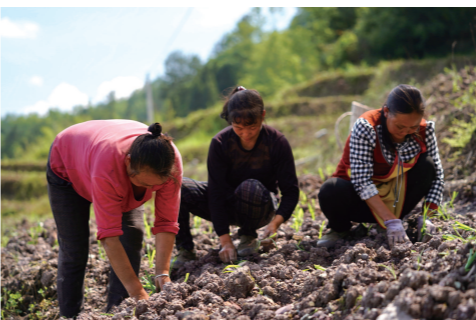
道真县隆兴镇莲池村高粱种植农户

化，便是各种农村产业如雨后天春笋般生长，过去是一方水土养不起一方人，不得不出门务工，如今却有了劳动力严重不足的困境；过去60岁以上无法出门务工，现在60以上的老人反倒成了乡村产业的劳动生产主力军。