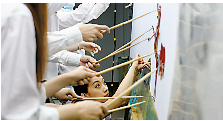
演员们呈现皮影舞蹈《乌鸦与狐狸》。