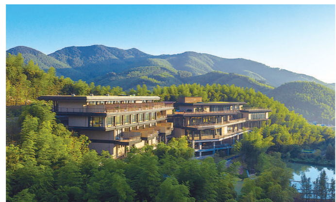
西塞山旅游度假区绿奢休闲度假项目

新政的及时出台掀起了重大项目攻坚和招商引资热潮，吸引了长三角地区越来越多的客商来湖州考察、洽谈项目合作。今年1至4月，吴兴区共签约引进项目66个，计划总投资242.05亿元。5月22日，在上海举办的长三角·吴兴产业推介会上，签约产业项目46个，计划总投资超471.82亿元。